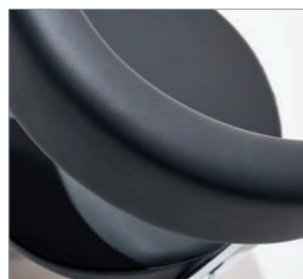
Bezug leitfähig „black“ ELECTRA