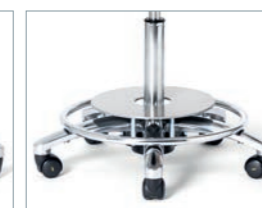
Fußauslösung mit Fußring