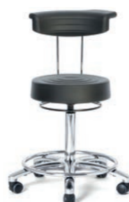
ARBEITSSTUHL 57 - 76 cm. Art.-Nr. 4019105 Fußring verchromt, Sitzpolster und Halbmondrücken aus Integralschaum, Schwarz, Ringauslösung, Sicherheitsrollen.