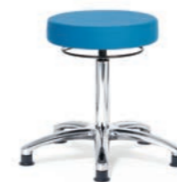
ARBEITSHOCKER 57 - 76cm. Art.-Nr. 4108305 RG 01 Kreuzfuß poliert mit Gleitern, Sitzpolster Ø 40 cm, Ringauslösung.