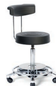
ARBEITSSTUHL 54 - 74 cm. Art.-Nr. 4015305 Fußauslösung, Sitzpolster und Halbmondrücken aus Integralschaum, Schwarz, Sicherheitsrollen.