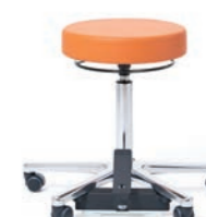
ARBEITSHOCKER 46 - 58 cm. Art.-Nr. 3008205 ZENTRAL Kreuzfuß poliert mit Zentralarretierung, Sitzpolster Ø 36 cm, Ringauslösung.