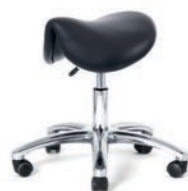
SATTELHOCKER 61-80 cm. Art.-Nr. 4178305 Kreuzfuß poliert, Sattelsitz, Handauslösung, Sicherheitsrollen

Die abgebildeten Beispiele sind nur eine Auswahl aus der Produktpalette.