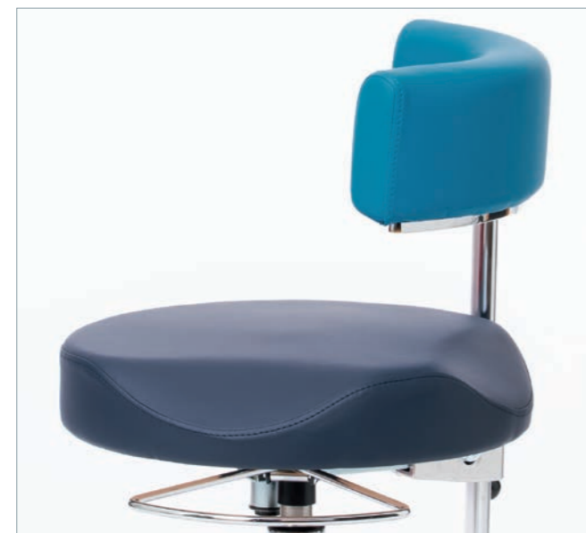
Ermüdungsfreies Handling durch Stützung für Arme oder Rumpf