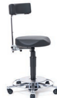
OP-ARBEITSSTUHL 54 - 74 cm. Art.-Nr. 4185305 ELECTRA Fußauslösung, Rückenlehne schwenk- und höhenverstellbar, Sitzpolster anatomisch Ø 40 cm, Bezug leitfähig ELECTRA, Säulenverkleidung und Sicherheitsrollen elektrisch leitfähig.