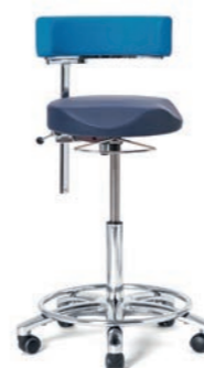
ARBEITSSTUHL 57 - 76 cm. Art.-Nr. 4185105 Fußring verchromt, Rückenlehne schwenk- und höhenverstellbar, Sitzpolster anatomisch Ø 40 cm, Höhenverstellung mit Handbügel, Sicherheitsrollen.