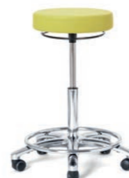
ARBEITSHOCKER 57 - 76 cm. Art.-Nr. 3009105 Fußring verchromt, Sitzpolster Ø 36 cm, Ringauslösung, Sicherheitsrollen.