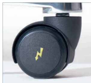
Elektrisch leitfähige Sicherheitsrollen ELECTRA