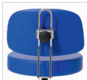
Große Rückenlehne hinten