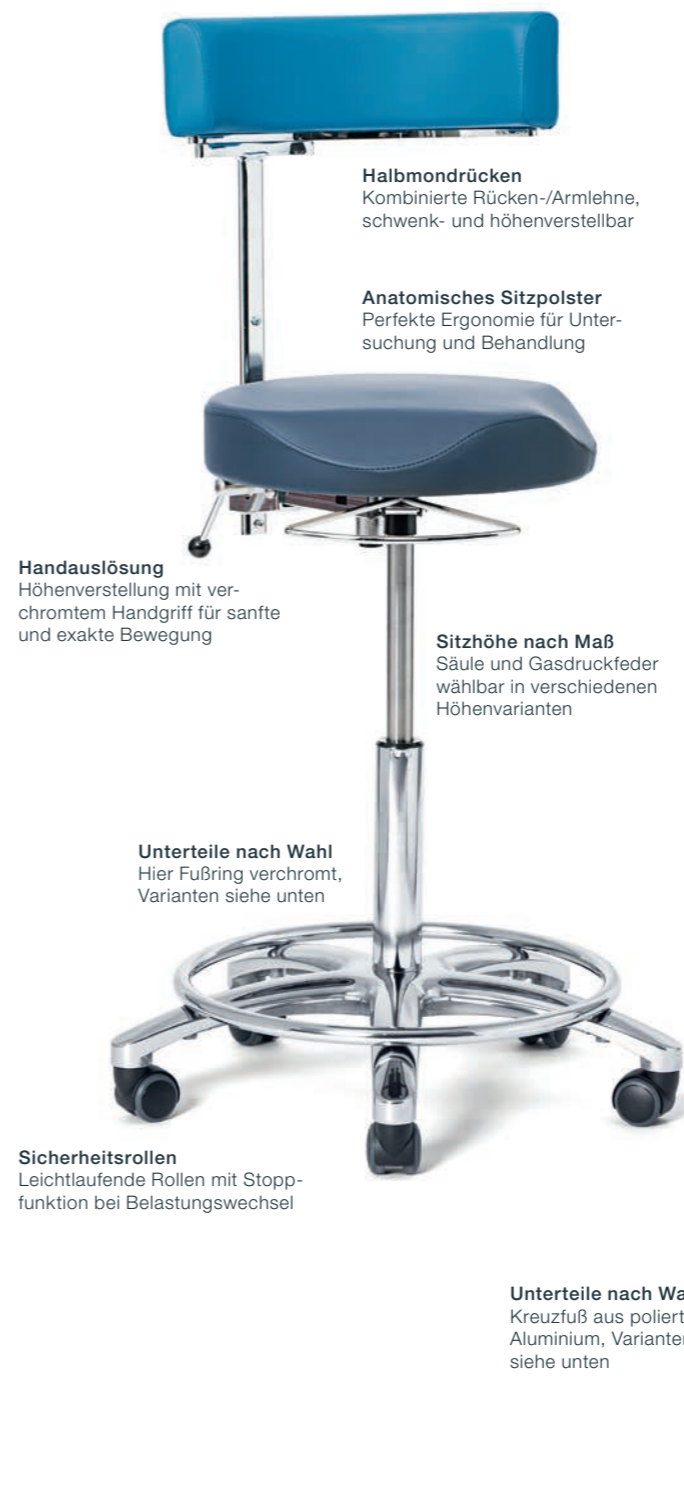
Halbmondrücken Kombinierte Rücken-/Armlehne, schwenk- und höhenverstellbar