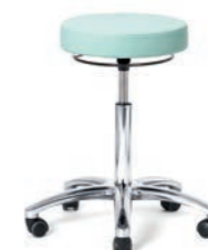
ARBEITSHOCKER 57 - 76 cm. Art.-Nr. 3008305 Kreuzfuß poliert, Sitzpolster Ø 36 cm, Ringauslösung, Sicherheitsrollen.