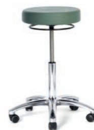
ARBEITSHOCKER 57 - 76 cm. Art.-Nr. 3008305 Kreuzfuß poliert, Sitzpolster Ø 36 cm, Ringauslösung, Sicherheitsrollen.

Lassen Sie sich inspirieren: Hier sehen Sie eine kleine Auswahl aus der Produktpalette der GREINER Arbeitshocker und -stühle. Hocker ohne Rückenlehne, Stühle mit Lehne in verschiedenen Ausführungen. Höhenverstellung per Hand oder Fuß. Unterteile und Sitzhöhen nach Wahl. Polstermaterialien in unterschiedlichsten Farbtönen erhältlich. Oder die OP-gerechte Ausstattung ELECTRA mit elektrisch leitfähigen Komponenten. Sie haben die Wahl.