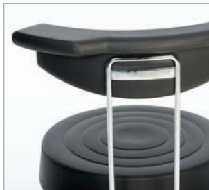
Modern funktionales Design