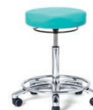
ARBEITSHOCKER 57 - 76 cm. Art.-Nr. 4129105 Fußring verchromt, Sitzpolster anatomisch Ø 40 cm, Ringauslösung, Sicherheitsrollen.