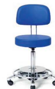
ARBEITSSTUHL 54 - 74 cm. Art.-Nr. 3045305 Fußauslösung, Rückenlehne höhenverstellbar, Sitzpolster Ø 40 cm, Sicherheitsrollen.