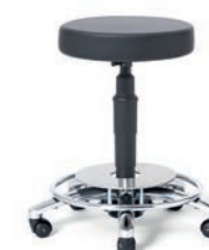
OP-ARBEITSHOCKER 54 - 74 cm. Art.-Nr. 4105305 ELECTRA Fußauslösung, Sitzpolster Ø 40 cm, Bezug leitfähig ELECTRA, Säulenverkleidung und Sicherheitsrollen elektrisch leitfähig.