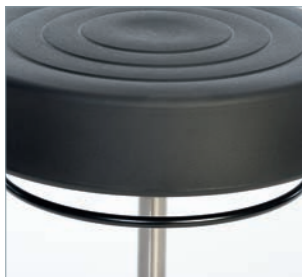
Neues Design, neue Handauslösung