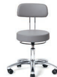
ARBEITSSTUHL 43 - 55 cm. Art.-Nr. 3018105 Kreuzfuß poliert, kleine Rückenlehne höhenverstellbar, Sitzpolster Ø 36 cm, Ringauslösung, Sicherheitsrollen.