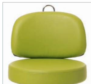
Große Rückenlehne vorn