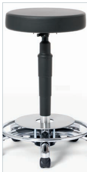
OP-gerechte Ausstattung ELECTRA mit elektrischer Leitfähigkeit