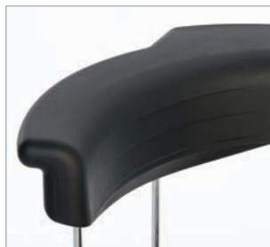
Rückenlehne aus geschäumtem Material