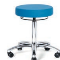
ARBEITSHOCKER 43 - 55 cm. Art.-Nr. 4108105 Kreuzfuß poliert, Sitzpolster Ø 40 cm, Ringauslösung, Sicherheitsrollen.