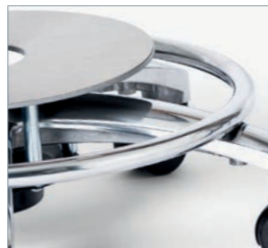
Fußauslösung mit Fußring