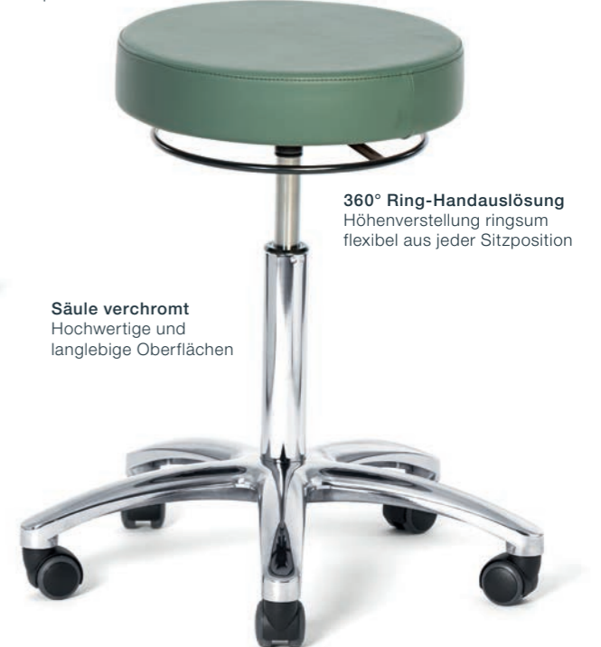
360° Ring-Handauslösung Höhenverstellung ringsum flexibel aus jeder Sitzposition