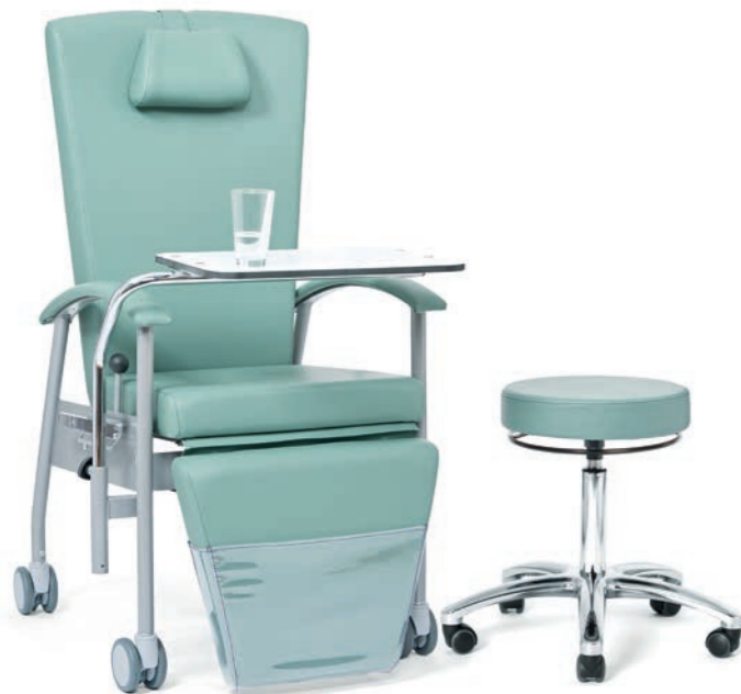
Arbeitshocker vielseitig passend zu jeder Behandlungs- liege

Sitzen wie ein Profi – arbeiten wie ein Profi. Anatomie, Ergonomie und Funktionalität prägen das Produktdesign der GREINER Arbeitshocker und -stühle. Moderner Sitzkomfort steht dabei nicht nur für komfortable Polster und leichtgängige Rollen – vielmehr leistet jedes funktionale Detail seinen Beitrag zu einer aktiven, ergonomischen und ermüdungsfreien Sitzposition.